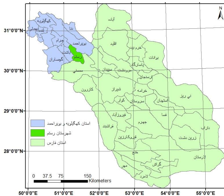
نقشه (۱): موقعیت شهرستان رستم در استان فارس

گجستان، آبشار پای توف) محل خوبی برای استراحت و تفریح گردشگران و مسافران می‌باشد. چشم انداز این منطقه رودخانه، کوه و آثار تاریخی می‌باشد و دارای بقاء متبرکه و مساجد می‌باشد و جمعیتی بالغ بر هفده هزار نفر می‌باشد که بالغ بر ۱۱۰ روستا و آبادی می‌باشد که شغل اکثر مردم کشاورزی و دامداری بوده است.