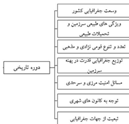
شکل (۱): عوامل مؤثر در دوران تاریخی بر نظام تقسیم‌بندی فضا در ایران (اعظمی و دبیری، ۱۳۸۹: ۱۷۷)

سازمان‌دهی سیاسی فضای هر کشور در قالب تقسیمات کشوری به اجرا در می‌آید. در واقع تقسیم‌بندی اداری - سرزمینی در هر کشوری، مبنایی برای سازمان‌دهی سیاسی و اداره آن کشور است (تومانیان، ۲۰۰۵: ۲۱). به طور کلی عوامل موثر بر تقسیم‌بندی فضای سرزمینی در ایران به دو دسته عوامل تاریخی و معاصر تقسیم می‌شود در دوران تاریخی عوامل زیر در تقسیم‌بندی فضای سرزمینی کشور موثر بوده‌اند (شکل ۱):