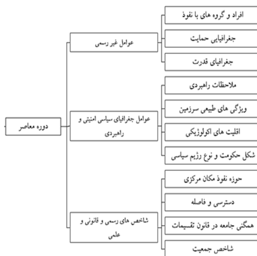
شکل (۲): عوامل مؤثر در دوران معاصر بر نظام تقسیم‌بندی فضا در ایران (اعظمی و دبیری، ۱۳۸۹: ۱۷۷)

در دوره معاصر نیز عوامل متعددی الگوی تقسیمات کشوری را تحت تأثیر قرار داده که به سه دسته: الف - شاخص‌های رسمی یا قانونی؛ ب - عوامل جغرافیای سیاسی، امنیتی و راهبردی؛ و ج - عوامل غیررسمی تقسیم می‌شوند (شکل ۲).