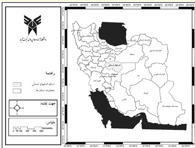
شکل (۵): تقسیمات کشوری پیشنهادی پژوهش حاضر در ارتقاء شهرستان کاشان و پیرامون به یک استان