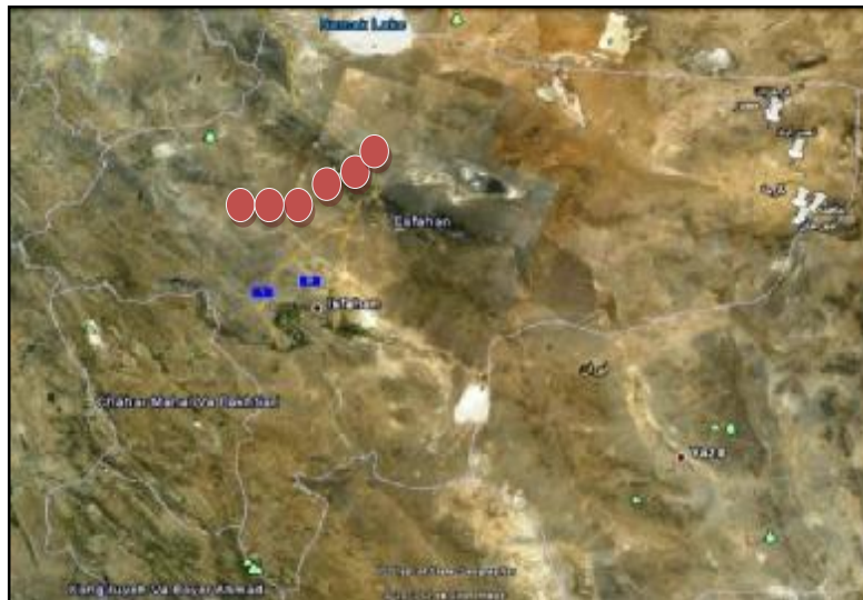
تصویر (1): معرفی موقعیت منظومه روستاهای هدف گردشگری شهرستان نظنز

منبع: بنیاد مسکن انقلاب اسلامی، خلاصه گزارش طرحهای هادی روستاهای شهرستان نظنز، 1390