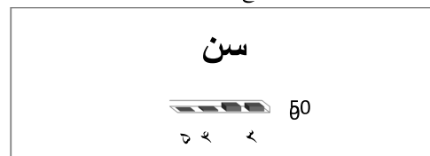
نمودار (۲): توزیع فراوانی سن پاسخگویان

یافته‌های جدول (۱) نشان می‌دهد که میانگین نظرات پاسخگویان در ارتباط با تأثیر ویژگی‌های قومی در شکل‌گیری محلات شهری ایلام ( m=3/460 ) می‌باشد که از مقدار آزمون ۳ بیشتر است و همچنین با توجه به سطح معنی داری برآورد شده که این مقدار در سطح (۰/۰۰۰) معنادار می‌باشد و در سطح اطمینان (۰/۹۵) می‌توان ادعا کرد که تأثیر ویژگی‌های قومی در شکل‌گیری محلات شهری ایلام بیشتر از حد متوسط است. از طرفی دیگر با مدنظر گرفتن یک طرفه بودن آزمون و مثبت بودن حد بالا و پایین، مقدار میانگین از مقدار مورد آزمون بیشتر است، در نتیجه فرض H_0 رد می‌شود، در واقع چون مقدار بحرانی بدست آمده از جدول برابر (۱/۶۴) است و t محاسبه شده با مقدار (۲۰/۵۶۵) از T جدول بیشتر است. فرض صفر رد و فرضیه پژوهش مورد تأیید واقع می‌شود. فرضیه دوم: تمایل به همگرایی اجتماعی در شکل‌گیری محلات شهری ایلام مؤثر بوده است.