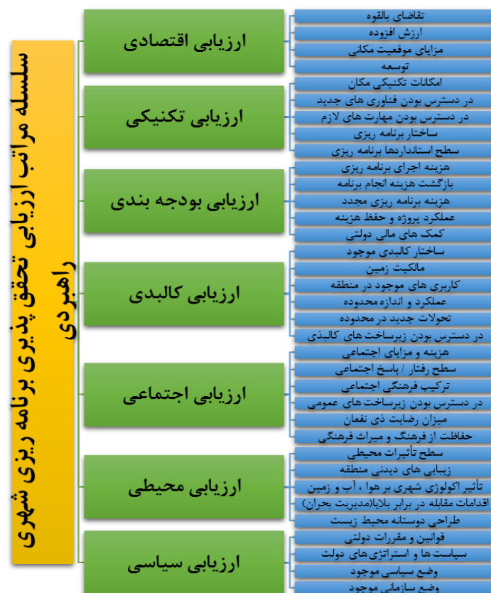
تصویر (۱): سلسلة مراتب ارزیابی تحقق پذیری برنامه ریزی شهری راهبردی

شاخص‌های مورد بررسی شامل ۷ شاخص به صورت ذیل می‌باشد، شاخص اقتصادی با ۴ گویه، شاخص تکنیکی با ۵ گویه، شاخص بودجه بندی با ۵ گویه، شاخص کالبدی با ۶ گویه شاخص اجتماعی با ۶ گویه، شاخص محیطی با ۵ گویه و شاخص سیاسی با ۴ گویه می‌باشند.