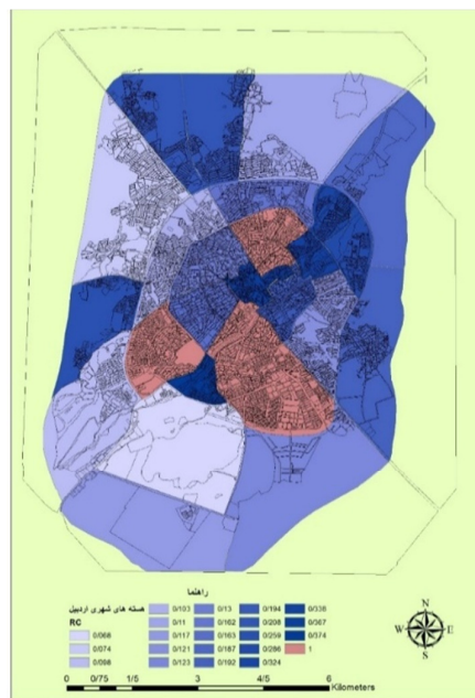
نقشه (۳): کارایی نهایی هسته‌های شهری اردبیل