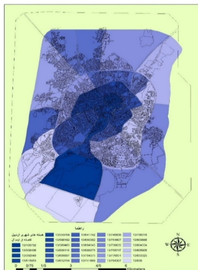
شکل (۱): نقشه فاصله هسته‌های شهری اردبیل از دیدگاه ایده آل

شهری (۲۰)، (۲۴) و (۲۲)، با ارزش ۱،۰۰۰، ۱،۱۴۶ و ۱،۵۳۶، کمترین ارزش کارایی را نسبت به دیدگاه ضدایده آل دارند. از نقطه نظر تفاوت کارایی بین \varphi_{ADMU} و \varphi_{j0} باید افزود که؛ تفاوت بیشتر بین \varphi_{ADMU} و \varphi_{j0} نشان‌دهنده عملکرد بهتر DMU_0 می‌باشد، هرچه تفاضل کارایی \varphi_{j0} از واحد مجازی ضدایده آل کمتر باشد نشانگر عملکرد ضعیف آن واحد می‌باشد. از دیدگاه ضد ایده آل، هسته‌های شهری (۵)، (۲)، (۸)، (۱۳)، (۴) و (۱۱)، با ارزش تفاضلی ۰.۹۷E+۱۰ ، ۰.۷۸E+۱۰ ، ۰.۴۸۶E+۱۰ ، ۰.۳۵E+۱۰ ، ۰.۲۱E+۱۰ و ۰.۹۰E+۹ ، بیشترین فاصله از آن دیدگاه؛ و هسته‌های شهری (۲۰)، (۲۴) و (۲۲)، به ترتیب با ارزش ۱، ۱.۱ و ۱.۵، کمترین فاصله از دیدگاه واحد تصمیم‌گیری ضد ایده آل با ارزش (۰.۰۳۹) را دارند. نقشه زیر نشان دهنده میزان فاصله هسته‌های شهری اردبیل از دیدگاه ضدایده آل می‌باشد.